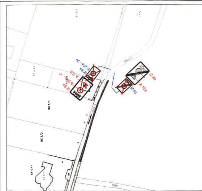
Příloha č.1 k č.j. KRPT-232958-2/ČJ-2024-070206 Příloha č.1 je nedílnou součástí vydaného písemného vyjádření Policie ČR.